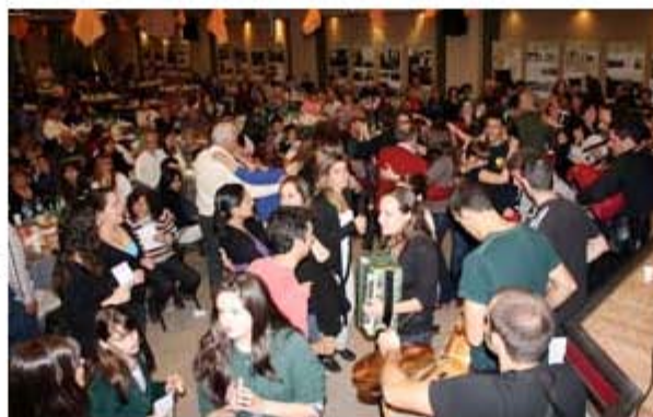
Una vez finalizadas las actuaciones, el baile se prolongó hasta altas horas de la madrugada.

Al término de las actuaciones, el baile, al son de las gaitas, continuó hasta la madrugada.